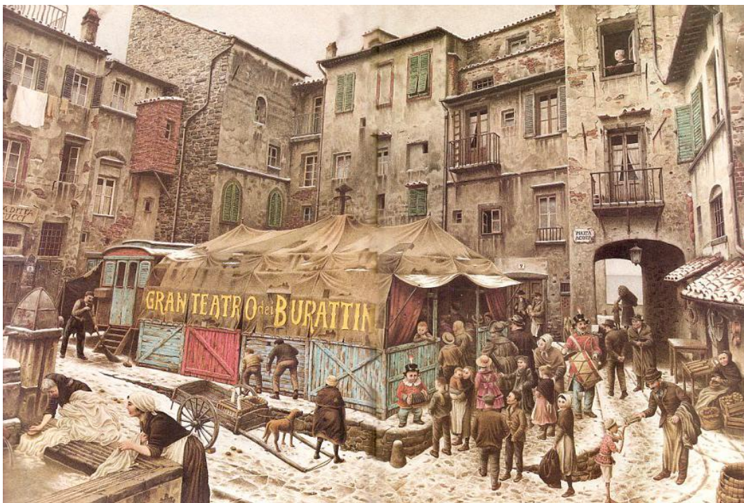
Pinocho. Ilustrado por Roberto Innocenti (Kalandraka / 2005)

Desde entonces, la obra ha sido traducida a cientos de lenguas con las más diversas ilustraciones, convirtiéndose en un clásico universal.